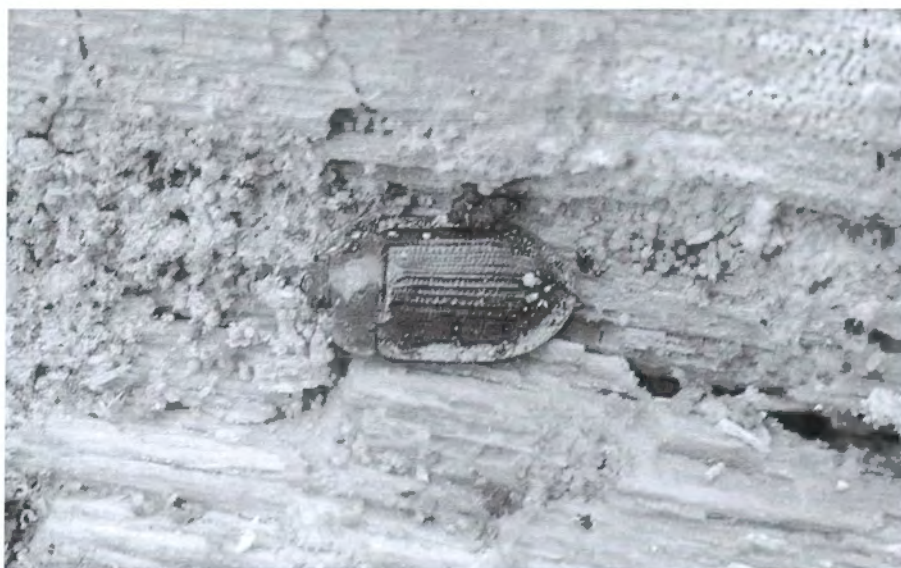
FIGURA 3. Ostoma ferruginea sota l'escorça de pi negre (refugi del Pla de la Font).