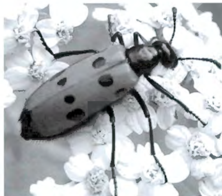
FIGURA 8. Mylabris quadripunctata sobre milfulles (pla de l'Infern).