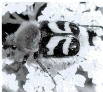
FIGURA 6. Trichius fasciatus sobre milfulles (pla de l'Infern).