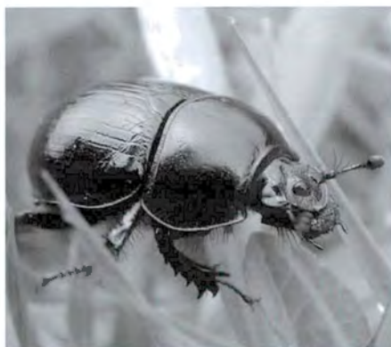
FIGURA 7. Anoplotrupes stercorosus sobre pastures (Palomera).