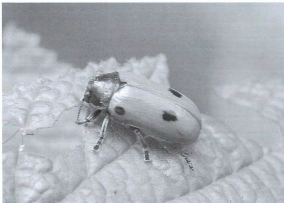
FIGURA 2. Clytra espanoli sobre un avellaner (proper al Centre de Natura).

Clytra espanoli Daccordi & Petitpierre, 1977, espècie descrita de la serra de Cazorla (Jaén), a Catalunya és poc freqüent a les zones pirinenques d'alçada superior als 1.500 m. Es localitza en arbres del gènere Quercus , Salix i Populus . També recol·lectada al Cadí. Espècie amb una biologia poc coneguda i molt interessant perquè la larva es desenvolupa dins de formiguers (figura 2).