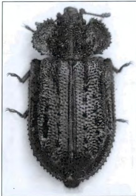
FIGURA 1. Calytis scabra .

Calytis scabra (Thunberg, 1784), espècie estrictament forestal i que viu sota les escorces dels pins. És un element eurosiberià relativament comú a l'Europa central i oriental, però fins fa poc no es coneixia de l'Europa occidental. L'any 2005 es va citar dels Pirineus centrals francesos. La recol·lecció d'aquesta espècie en l'espai natural estudiat del vessant sud dels Pirineus és molt remarcable ja que representa la primera citació ibèrica (figura 1).