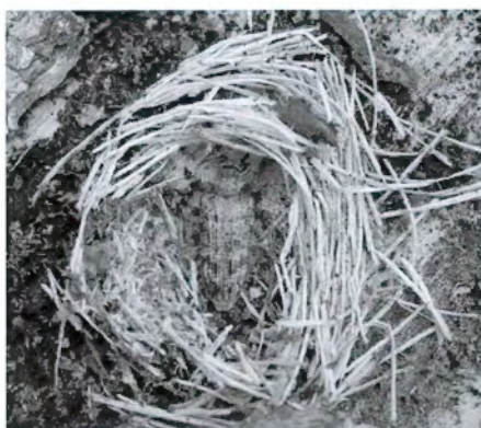
FIGURA 5. Rhagium inquisitor en la cel·la de pupació sota l'escorça de pi negre (refugi del Pla de la Font).

En l'espai natural d'aquest estudi abunden els conreus, els horts i els prats de dall, cosa que produeix una fragmentació de l'hàbitat que actua de manera negativa i pot provocar una disminució de la biodiversitat. En aquests ambients que acostumen a ser molt homogenis i amb un recobriment arbustiu simplificat, la varietat i abundància d'espècies és molt